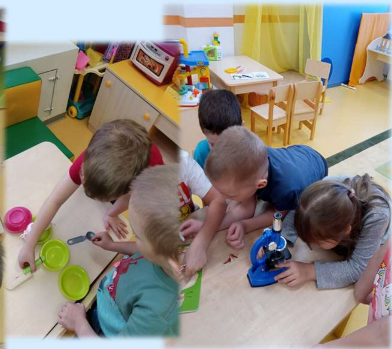
Формирование основ естественно-научной грамотности у дошкольников в МБДОУ № 8 «Иволга»