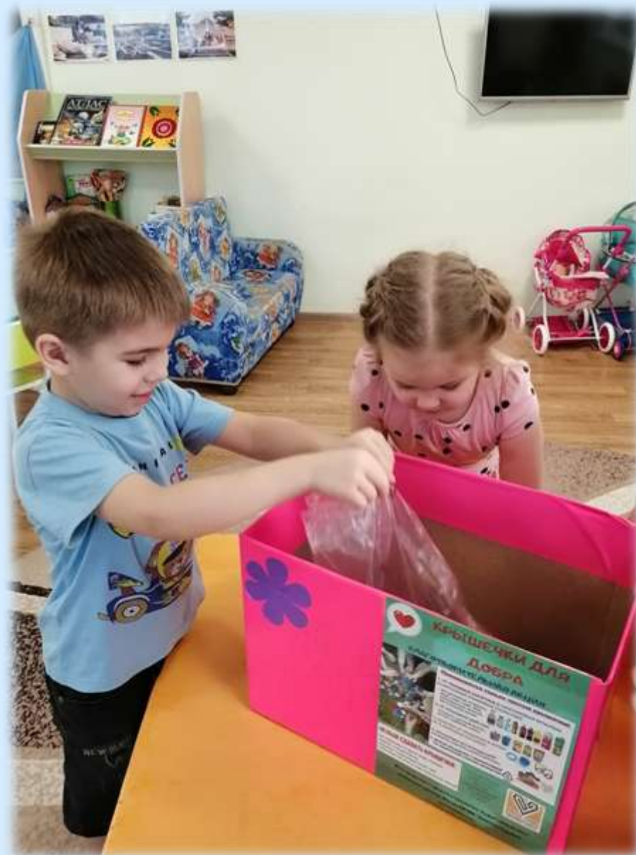
Акция «Крышечки добра»