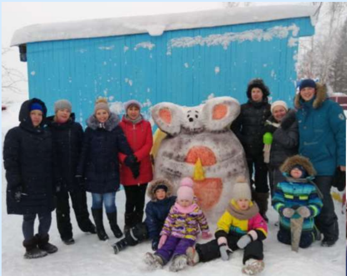
Встреча с родителями в рамках детско-родительского клуба «Субботничек» в МБДОУ №5