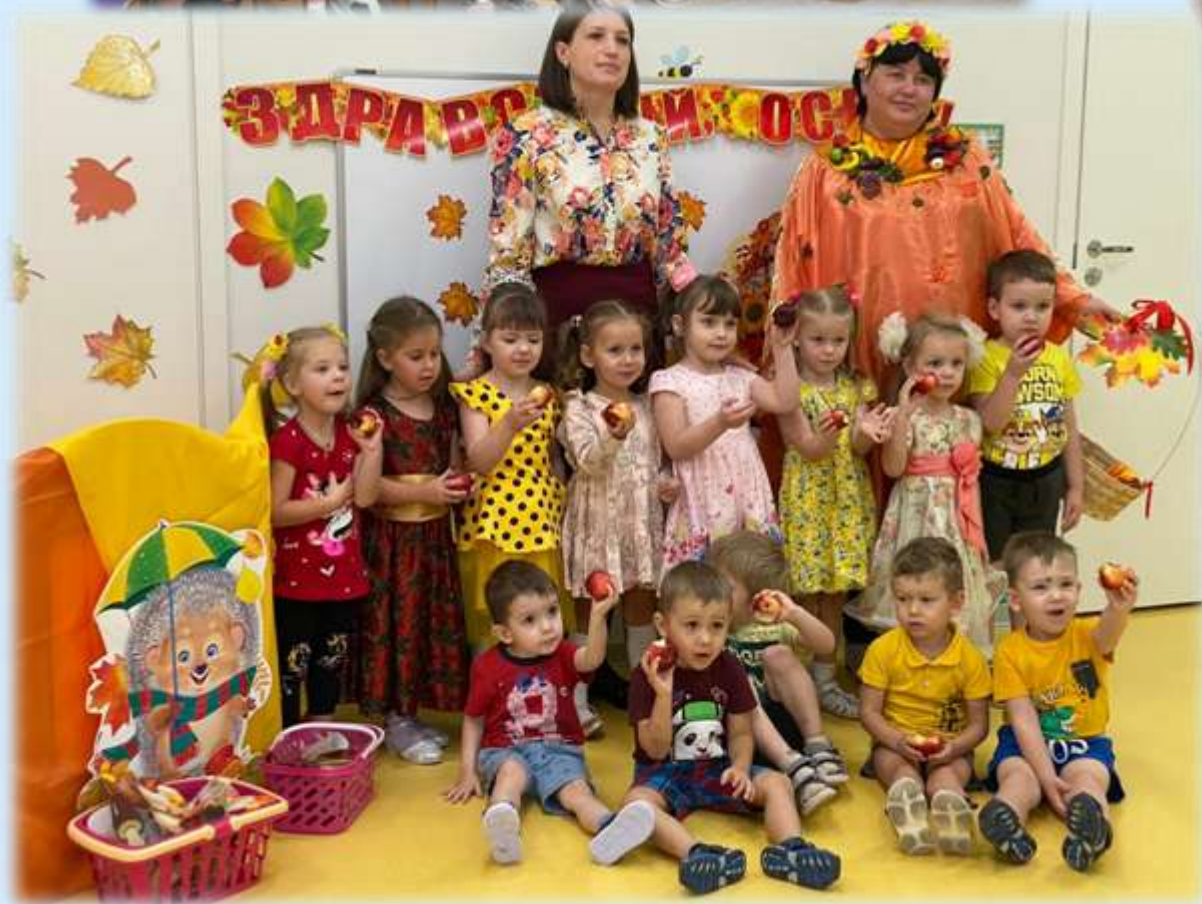
Праздники и досуг