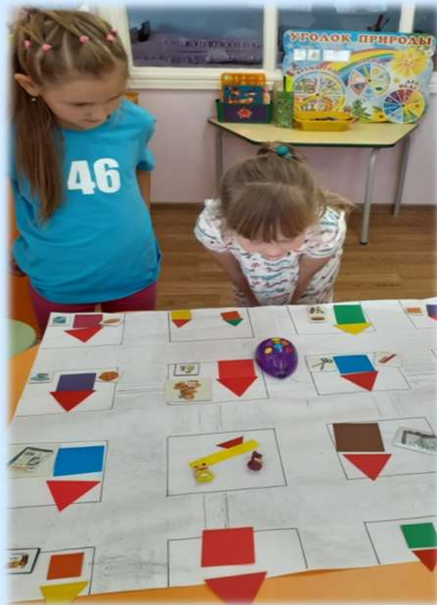
Формирование математической грамотности через применение STEAM –технологии в МБДОУ №3