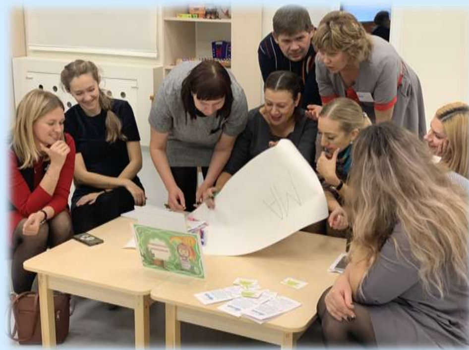
Общее родительское собрание