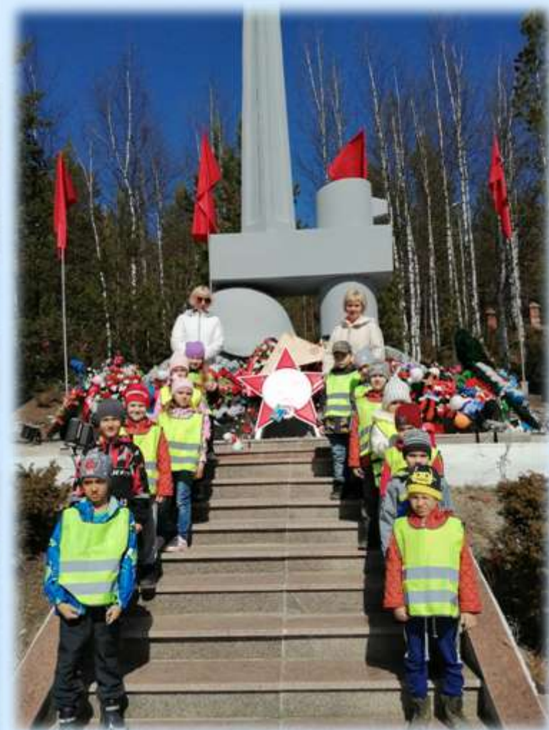
Акция «Красная гвоздика» к празднованию Победы в Великую Отечественную войну»