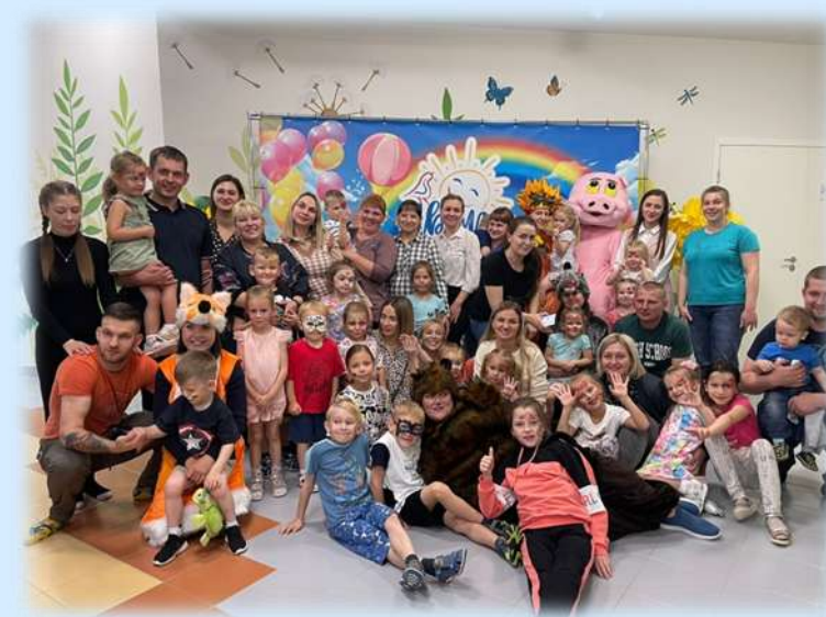
Мероприятие в рамках проекта «Планета детства»