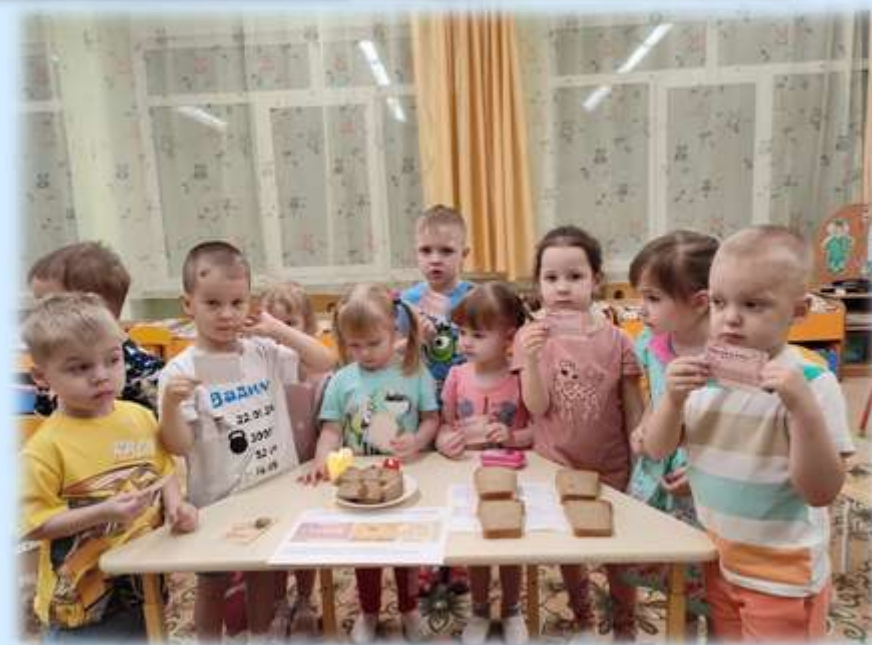
Акция «Блокадный хлеб»