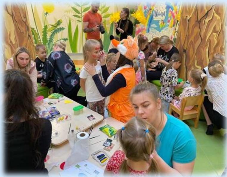
Квест-игра «Семейное путешествие»